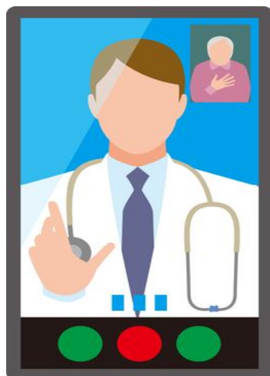
患者様側のスマートフォン等